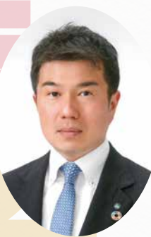
日本木材青壮年団体連合会 令和2年度 会長