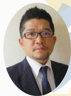
日本木材青壮年団体連合会 全国大会実行委員長

新型コロナウイルスの影響が考えられる中での開催となりますが九州熊本大会にて皆様とお会い出来ることを楽しみにし、多くのご参加をお願いいたしまして、ご挨拶とさせていただきます。