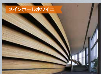
メインホールロビー